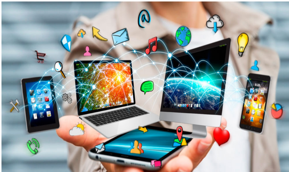
La imagen representa las plataformas digitales y el ser humano en sociedad.

El 95% de los alumnos utilizan el Facebook, algunas de las plataformas digitales más utilizadas son: YouTube, Twitter, TikTok, Instagram, LinkedIn, en la actualidad los jóvenes están inmersos en estas plataformas digitales.