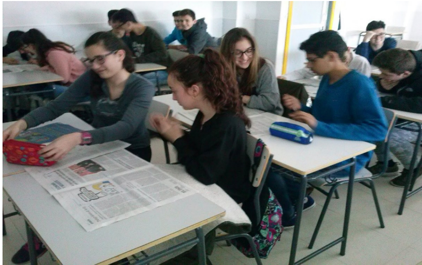
La imagen representa, el socializar con compañeros.

Dando respuesta a las preguntas, para los jóvenes universitarios el regresar a clases significa: que el 90% les gusta socializar con sus compañeros, maestros y comunidad estudiantil.